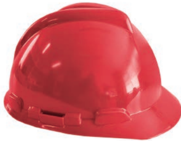
Tipo I Clase C