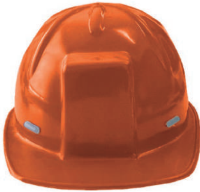
Casco de Protección Dalmau

El Casco de Protección Dalmau está diseñado para dar protección a la cabeza