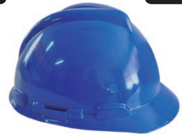
Tipo I Clase G

Los cascos de seguridad Dalmau® PD1000 son cómodos y resistentes. Diseñados para proporcionar protección de la parte superior de la cabeza.