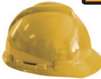
Tipo I Clase E